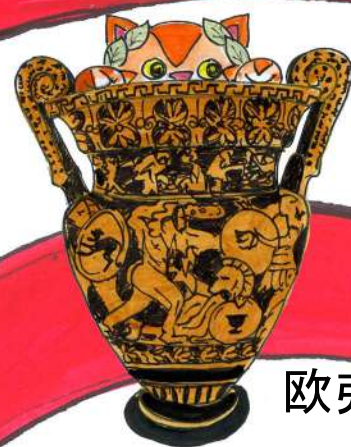
欧弗洛尼奥斯的作品