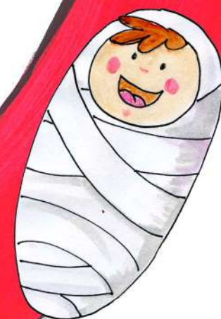
来自卡斯特尔塞克的新生儿。