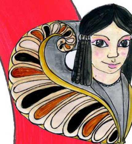
伊特鲁里亚斯芬克 斯狮身人面像