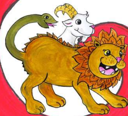
阿雷佐的喀迈拉铜像