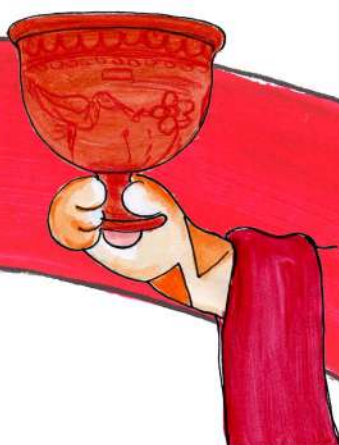
阿泰尤斯的陶花瓶