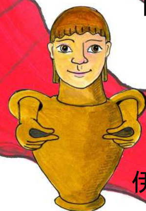
伊特鲁里亚的骨灰瓮