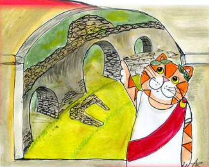
从最初的古罗马圆形剧场， 到修道院，再到现在的博物 馆。