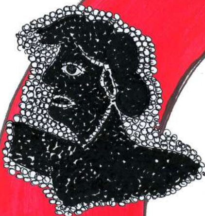
尼普顿海王的马 赛克