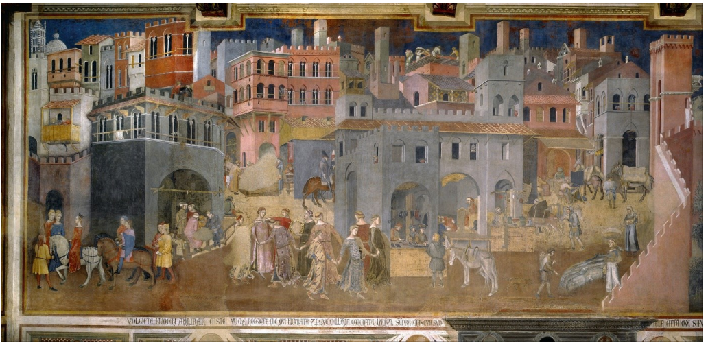
Buon governo in città *

Poi Lorenzetti rivolge la nostra attenzione al cattivo governo. Possiamo dire che questa è la vivida rappresentazione dell'insostenibilità. Ci sono i malati che giacciono per le strade, come se il Covid avesse colpito con una distribuzione non corretta dei vaccini. C'è il crollo delle infrastrutture e lo sgretolamento degli edifici. Il commercio è chiuso. Nelle campagne, eserciti opposti si confrontano, forse le truppe russe e ucraine che combattono nel Donbas.