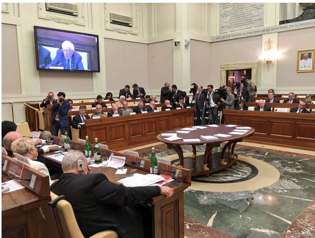
Pontificia Accademia delle Scienze Sociali, Casina Pio IV

Al raduno della scorsa settimana della Pontificia Accademia delle Scienze Sociali i partecipanti hanno discusso di come la guerra in Ucraina possa essere portata rapidamente a termine al tavolo dei negoziati – al fine di fermare le massicce uccisioni, la distruzione devastante del patrimonio ucraino e lo tsunami globale derivante dall'aumento dei prezzi dei prodotti alimentari e dell'energia che interessa ora tutto il mondo. L'eccellente leader globale nel settore alimentare e agricolo qui con noi oggi, il Dottor Dongyu Qu, sta dando enormi contributi in tutto il mondo per aiutare i paesi a nutrirsi e affrontare gli shock della pandemia e della guerra. Tuttavia, a mio parere, la pace dovrebbe essere il primo passo verso la fine della fame globale, fornendo il fondamento della cooperazione globale su cui gli sforzi del Dottor Qu possono basarsi.