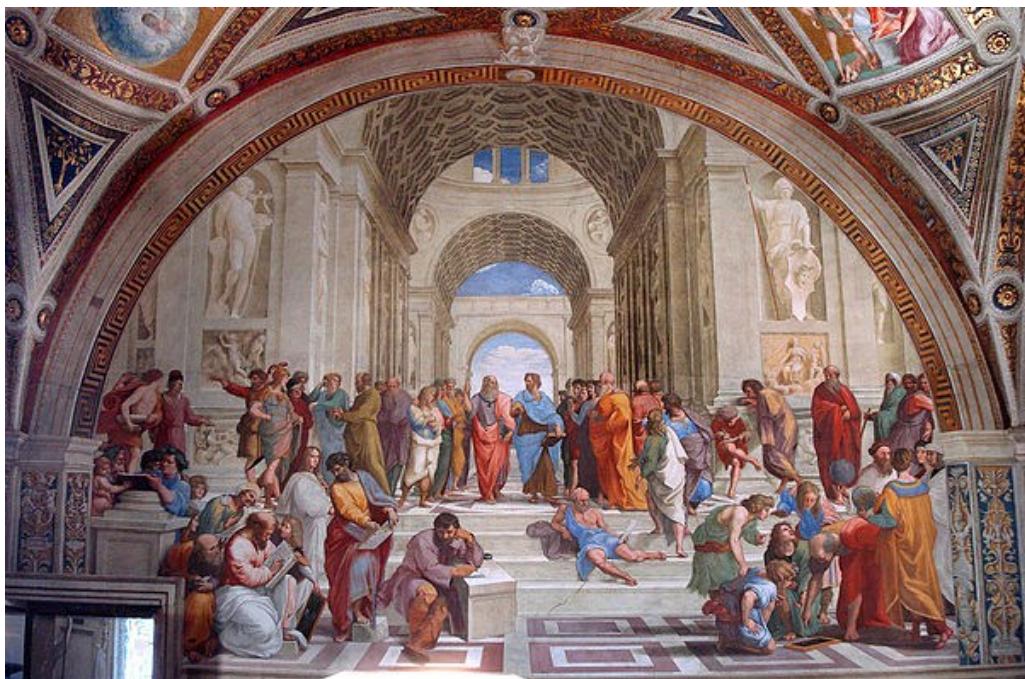
Scuola di Atene, Raffaello

L'altra sala che la scorsa settimana mi ha profondamente ispirato è la sala riunioni della Pontificia Accademia delle Scienze presso la Casina Pio IV, Città del Vaticano. La Pontificia Accademia è un'altra antica istituzione con radici che risalgono all'Accademia dei Lincei dei primi anni del Seicento. L'Accademia dei Lincei, che ha avuto Galileo Galilei come socio fondatore, e la Pontificia Accademia delle Scienze oggi, si basano sull'idea di unire il sapere scientifico all'etica della dignità umana al servizio del bene comune.