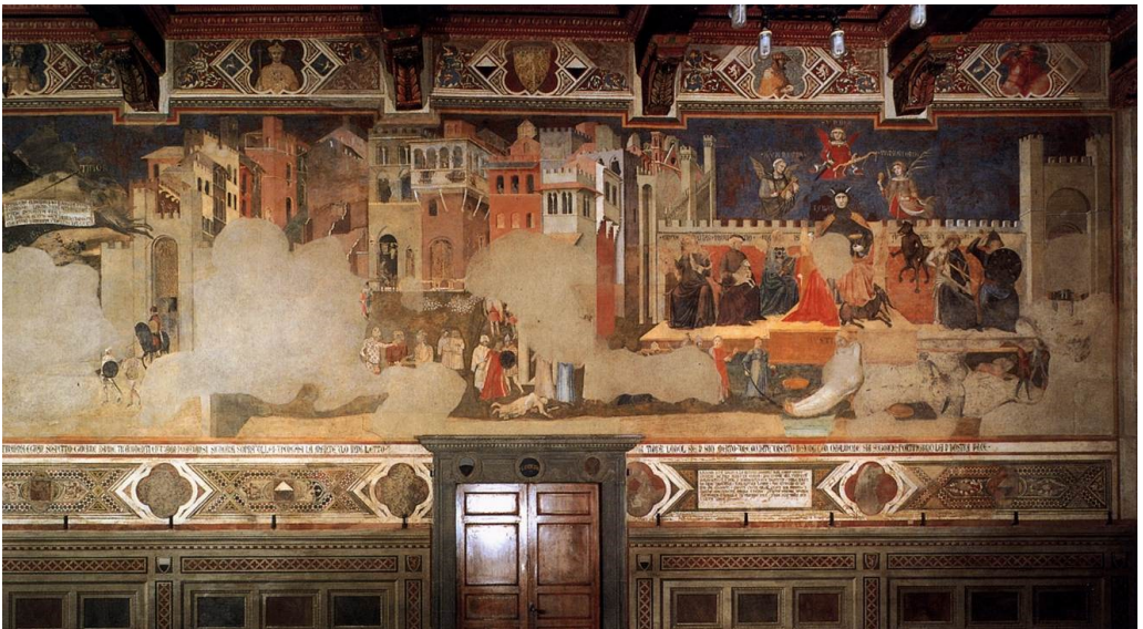
Cattivo governo in città *

Poi Lorenzetti rivolge la nostra attenzione al cattivo governo. Possiamo dire che questa è la vivida rappresentazione dell'insostenibilità. Ci sono i malati che giacciono per le strade, come se il Covid avesse colpito con una distribuzione non corretta dei vaccini. C'è il crollo delle infrastrutture e lo sgretolamento degli edifici. Il commercio è chiuso. Nelle campagne, eserciti opposti si confrontano, forse le truppe russe e ucraine che combattono nel Donbas.