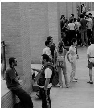
Prestiti fiduciari, bando in scadenza

È disponibile il bando per la concessione dei prestiti fiduciari per l'anno accademico 2008/09, che permette agli studenti in possesso di determinati requisiti di reddito e merito di aprire una linea di credito su conto corrente bancario dal quale prelevare un importo massimo annuo