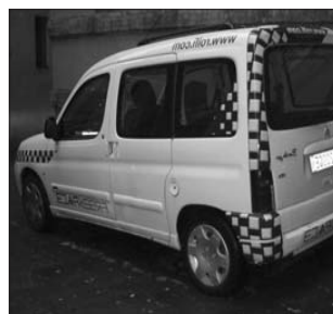
Il pulmino attrezzato per il trasporto e l'accompagnamento degli studenti