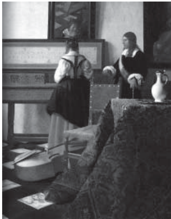
Vermeer, A Lady at the Virginals with a Gentleman (dettaglio).