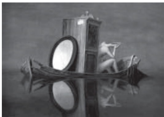
Wolfgang Lettl, Der Spiegel der Erinnerung .

Il ritmo, nella scrittura di Bonnefoy, è un fiume, ama l'adagio e il largo. La lentezza è il dispiegarsi della cosa – del fiore? – verso la luce, dall'ombra. Un salire verso l'invisibile inteso, appunto, come « délivrance du visible ». Una visione che non cancella le voci, né le ombre, né i silenzi, e neppure i passi, i lenti passi sulle pietre, i passi che vanno verso una barca vuota, bagnata dall'ultima luce del giorno.