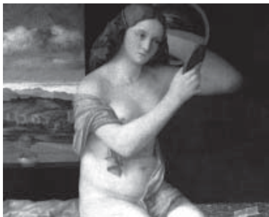
Giovanni Bellini, Donna allo specchio .

Sulla parete di un palazzo in Rue Descartes, a Parigi, c'è un grande albero blu di Pierre Alechinsky; vicino all'albero c'è una poesia scritta sul muro dal titolo L'albre con la firma di Yves Bonnefoy.