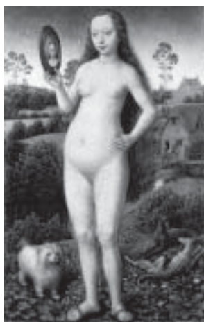
Memling, Vanità .

E tuttavia la traduzione si compie e fa la sua strada. L'autore ha perso la presa sull'opera sua, è fuori gioco nel più vistoso dei modi. Si conferma, anche così, che il «paese natale» è paese perduto per definizione. L'atto del traduttore (atto mancato, in un certo senso, e nell'altro senso, atto molto potente) avvia per l'opera la sorte benedetta della migrazione, il suo passaggio ad altro, il suo investimento teoricamente inesauribile. L'autore ha la sua speranza, se non altro, fondata sul fatto che la traduzione appartiene ormai al regno delle cose non più uniche, non più identiche solo a se stesse, sta fra i prodotti rinnovabili, che dunque sono socialmente controllati, o controllabili. Ma questo è un altro discorso.