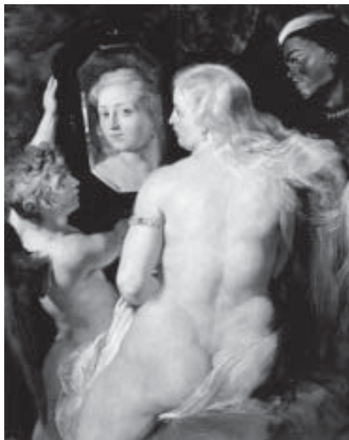
Rubens, Venere allo specchio .