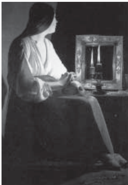
Georges de la Tour, Maddalena penitente .