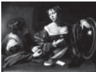
Caravaggio, Conversione della Maddalena .