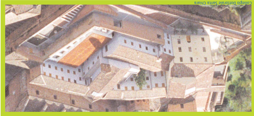
Collegio Dottorale Santa Chiara

Scuola Superiore dell'Università di Siena