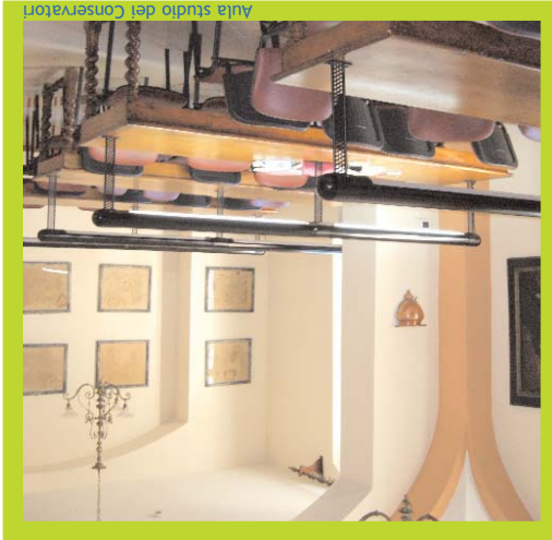
Aula studio dei Conservatori