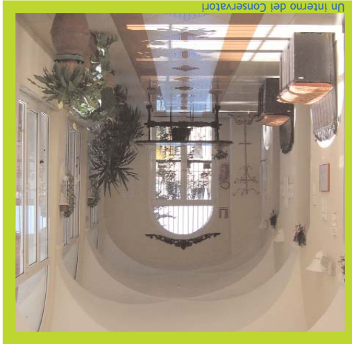
Un interno dei Conservatori