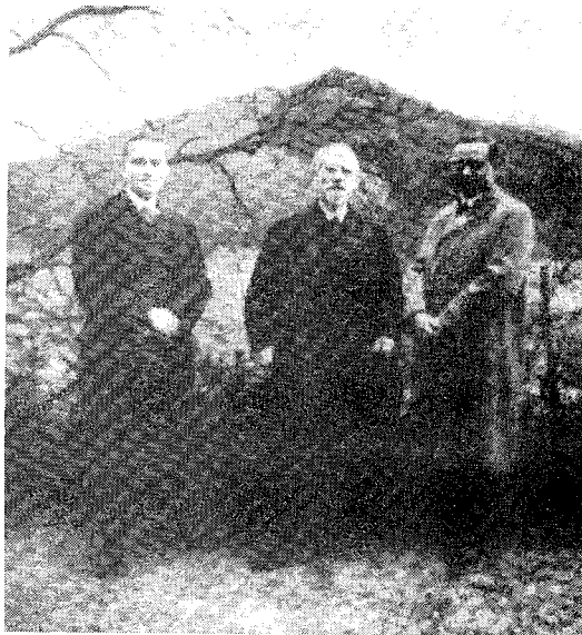
Patočka con Husserl e Fink a Friburgo