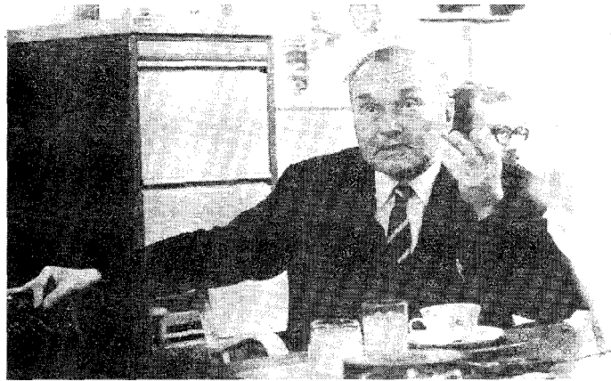
Durante un seminario privato

drammaturgo Pavel Kohout, lo scrittore Ivan Klíma). Nel 1972, il regime può finalmente “toglierselo dai piedi”, ponendolo anticipatamente in pensione. Da quella data, a parte l'avventurosa partecipazione ad un Convegno su Comenio a Varna (Bulgaria), la sua attività didattica è consegnata esclusivamente ai seminari che tiene in casa sua, alla presenza di ex-allievi ed intellettuali amici.