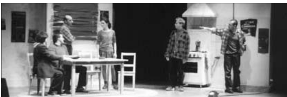
Vita da studenti: "Gabriele", di Fausto Paravidino