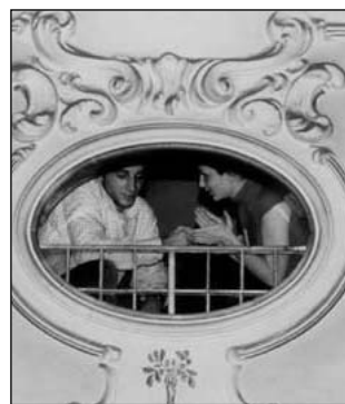
Studenti alla Chigiana