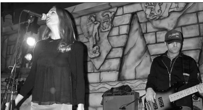
Il pop più di moda: il concerto dei Delta V

Un cartellone di teatro, musica pop, classica; incontri con autori e personaggi del mondo dello spettacolo; un coro di Ateneo e un laboratorio teatrale; un festival degli artisti studenti: tutto questo è "Parole & Musica", la rassegna culturale dell'Università di Siena per la comunità di Ateneo. "Parole&Musica" chiude con la festa di Pontignano la sua sesta edizione: sempre di più la rassegna culturale è diventata un segno distintivo dell'Università di Siena. Come ogni anno, la stagione appena conclusa ha spaziato tra tutti i generi della musica e del teatro: due concerti di musica pop, cinque concerti di genere classico o etnico presso l'Accademia Musicale Chigiana, sei appuntamenti con il teatro. Spettacoli e concerti diversi per stile e contenuti, ma con un tratto distintivo: una drammaturgia giovane, sia per i contenuti, di grande attualità, sia per la scrittura, affidata ai nuovi talenti.