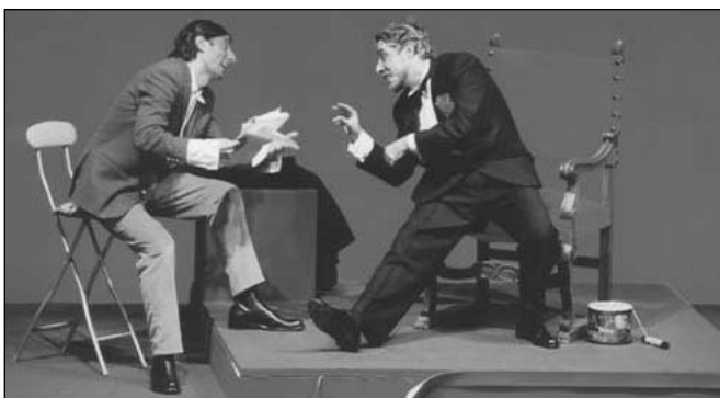
Sferzante ironia: "Serata di Gala", di Claudio Morganti

Pontignano le foto, scattate da Pietro Bubba Bello, saranno esposte in una piccola mostra che riassume i momenti più significativi della stagione. Le foto raccontano le performance degli artisti, ma anche i volti dei tanti giovani che hanno assistito agli spettacoli, e che si potranno rivedere, riconoscendo anche i propri amici.