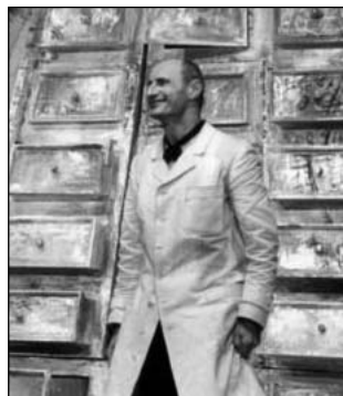
"Il tempo al di là del mare"